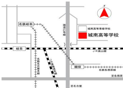
名鉄各務原線細畑駅下車徒歩5分